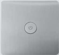
Steuerung 1/Système de contrôle 1 Knopf Ein-Aus/Bouton On-Off