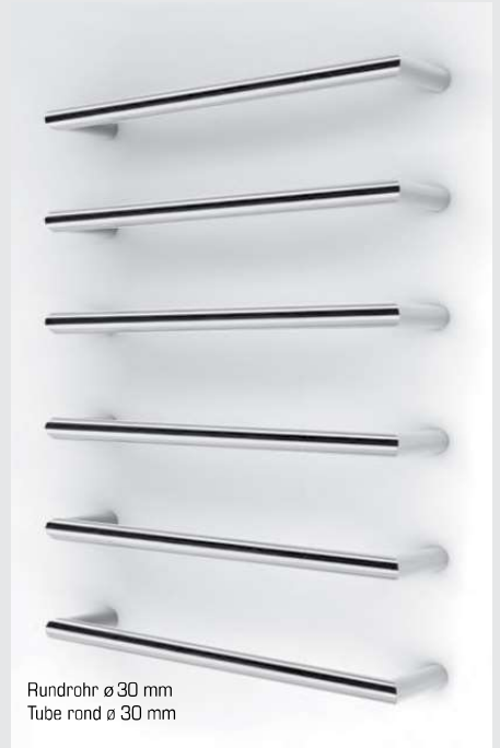
Rundrohr ø 30 mm Tube rond ø 30 mm